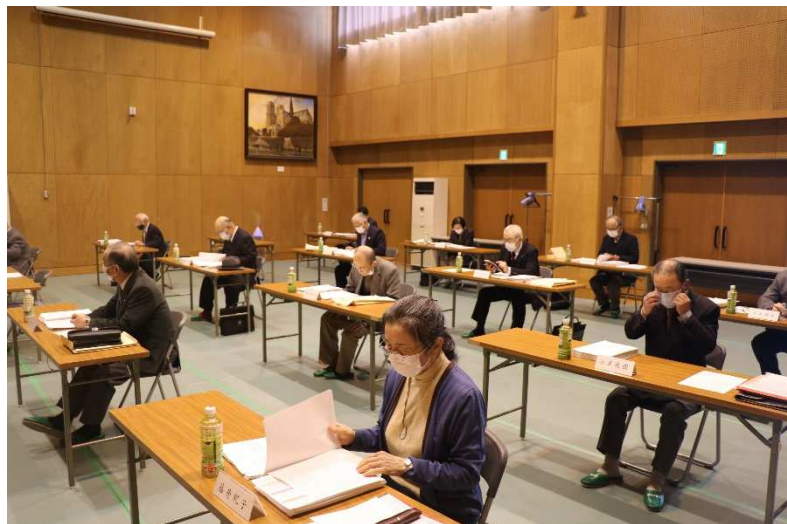
「新型コロナ」仕様の配席にしてあります。