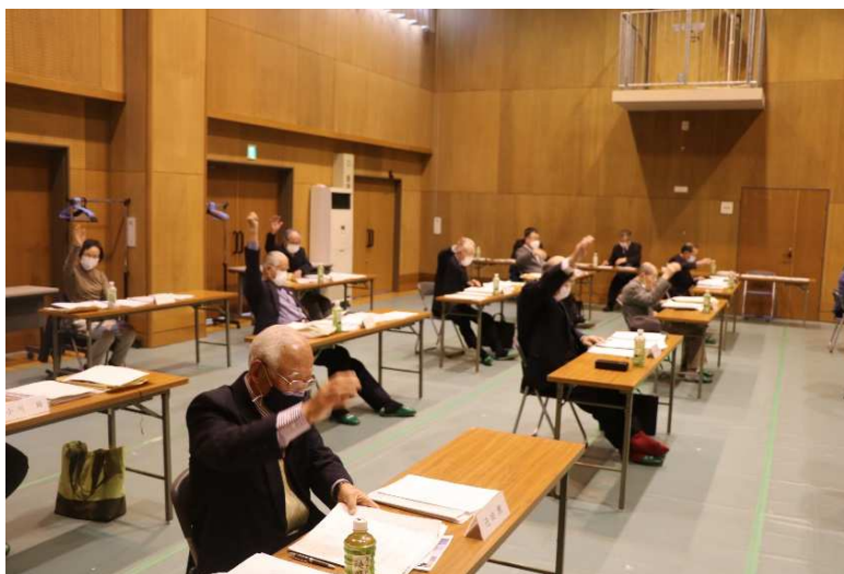
当法人の理事会では、挙手で採決をしています。